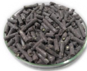
Prévia do Produto