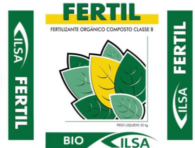
Rótulo do Produto